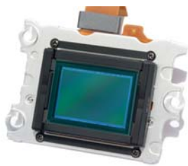
Figura 1 - El sensor

Las cámaras de fotos digitales no son más que computadoras con una lente adelante de un sensor, y la función específica de tomar fotografías